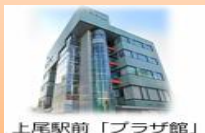
上尾駅前「プラザ館」